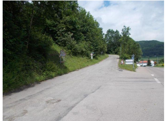
ZUFAHRT VON HAUPTSTRAÙE