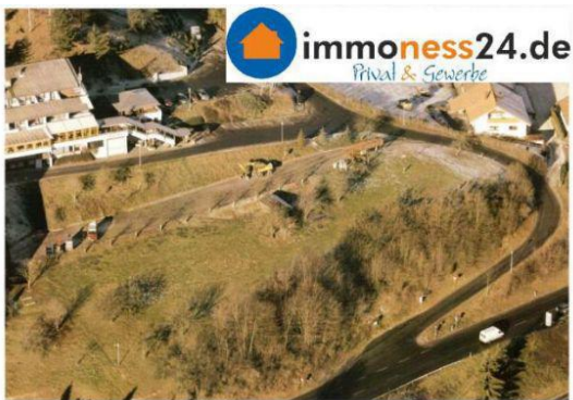
GRUNDSTÜCK VON OBEN