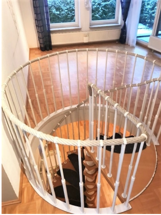
Wohnzimmer mit Wendeltreppe