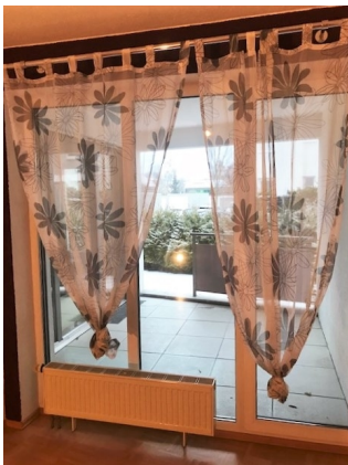
Blick ins Grüne