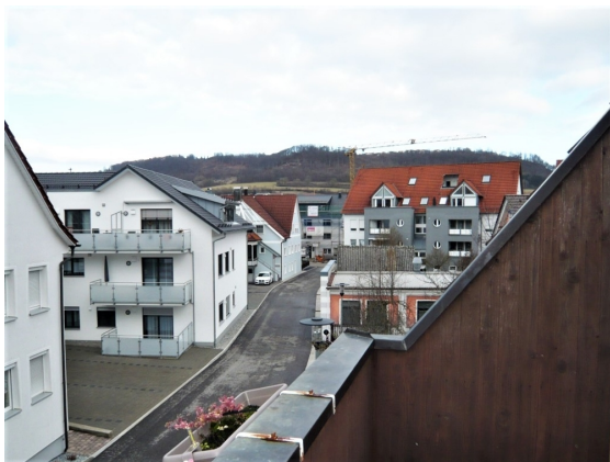
DG Dachterrasse Aussicht