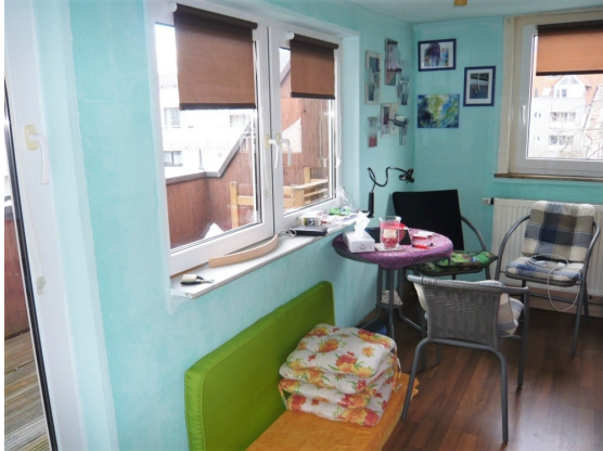
DG Zimmer 1