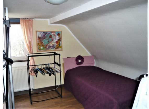
DG Zimmer 2