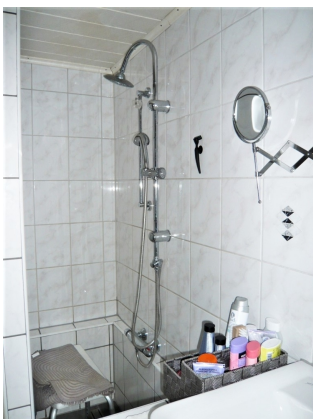
OG Bad Dusche