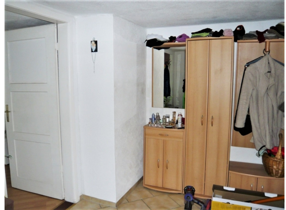
EG Diele (Küche)