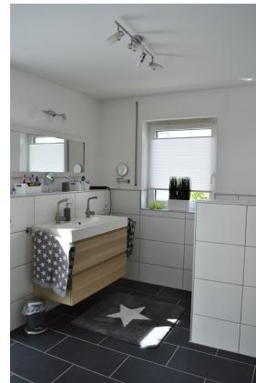
Badezimmer 2. OG