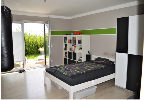
Kinderzimmer 2 EG