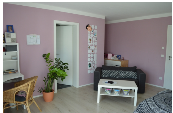
Kinderzimmer 1 EG