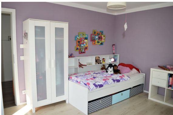
Kinderzimmer 2. OG