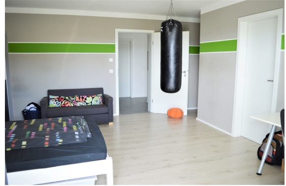
Kinderzimmer 2 EG