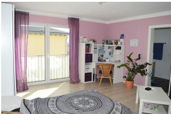
Kinderzimmer 1 EG