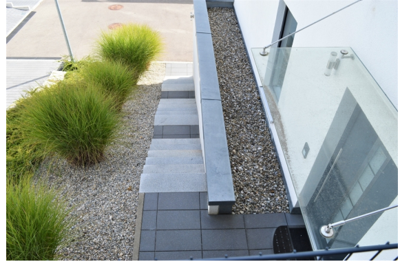
Treppe zum Eingang