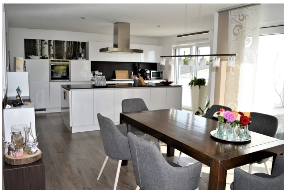
Küche u. Esszimmer 1.OG