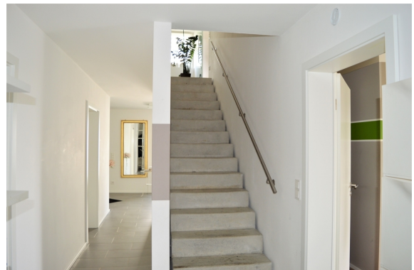
Treppe zum EG