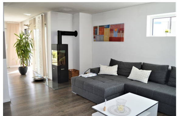
Wohnzimmer 1. OG