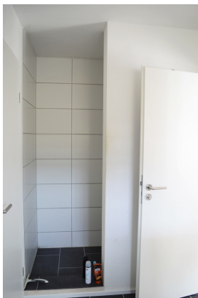
Badezimmer Dusche EG