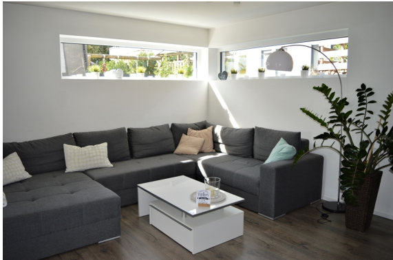
Wohnzimmer 1. OG