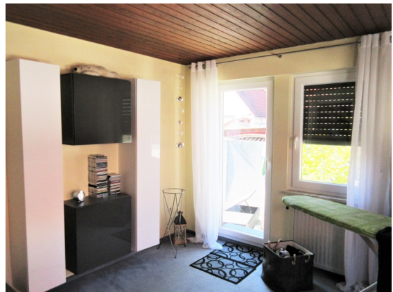
Zimmer zum Balkon