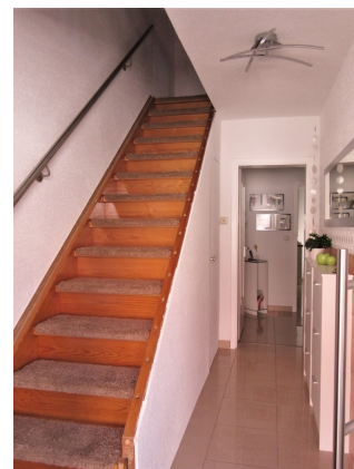
Eingang mit Treppenaufgang