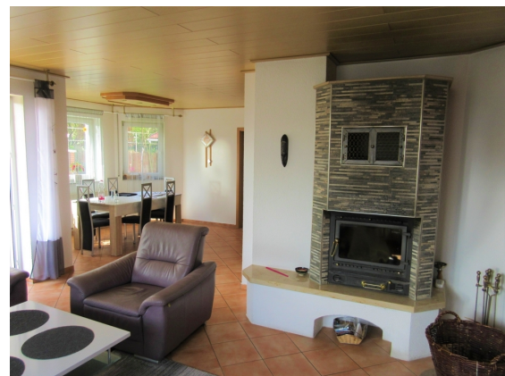
Wohnzimmer mit Blick zum Esszimmer