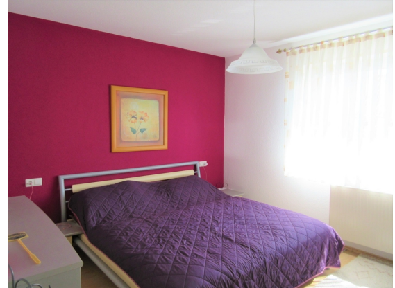
Zimmer 2 EG