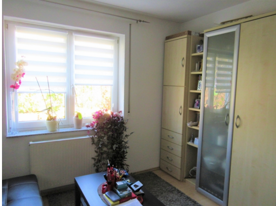
Zimmer 1 EG