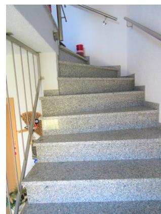
Treppe zum OG