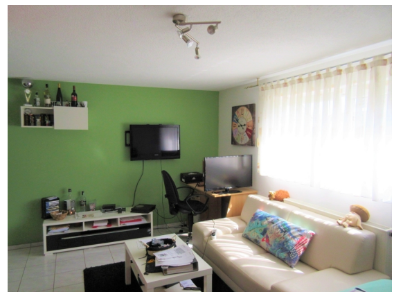
Zimmer 2 UG