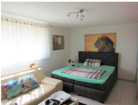
Zimmer 2 UG