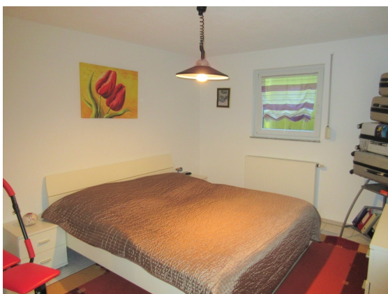
Zimmer 3 UG