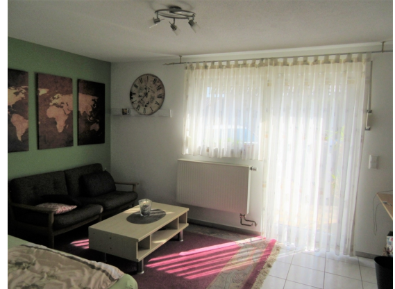
Zimmer 1 UG