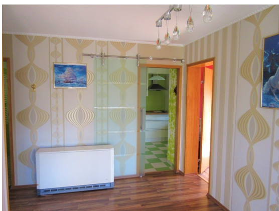
Esszimmer Zugang Küche