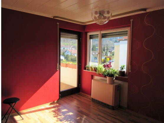
Zimmer Zugang Balkon