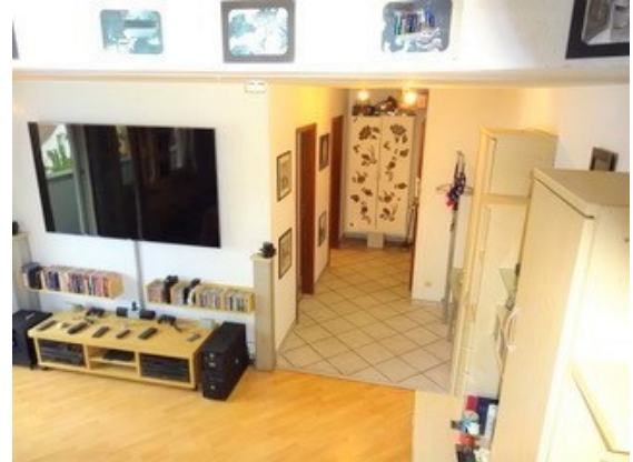
Blick von der Treppe in den Flur