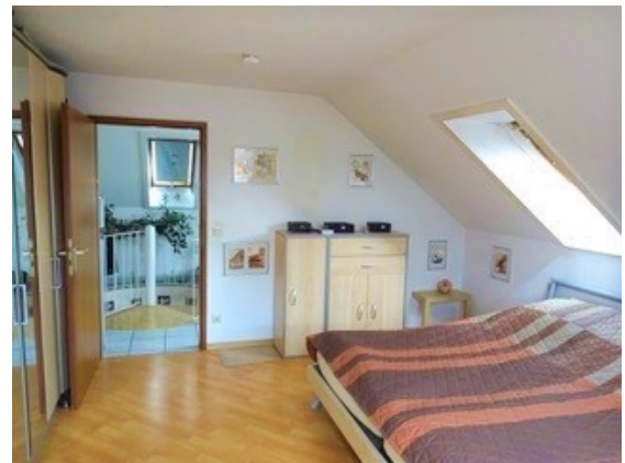
Blick auf die Galerie