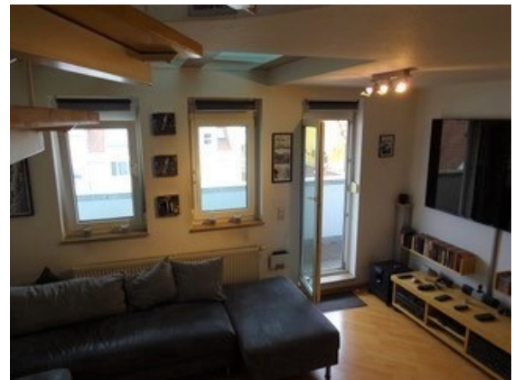
Blick von der Treppe ins Wohnzimmer